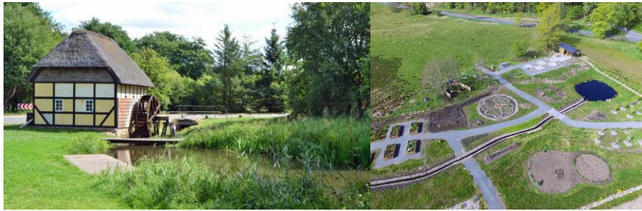
Tvis Mølle og Tvis Mølle Have